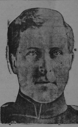
ALBERTO Leopoldo Clemente Marie Meinard, Rey de los Belgas, Duque de Saxe, Príncipe de Saxe Coburgo y Gotha. Nació en Bruselas el 8 de Abril de 1835; Rey de los Belgas desde el 23 de Diciembre de 1909.

May grado es para LA INFORMACION con motivo del natalicio del Rey de los Belgas Alberto 1º, que se celebró el domingo pasado, enviar al noble y heroico soberano el testimonio de la devoción y simpatía las cuales encuentra este periódico, dice méritos para renovar cada día, a necesidad que en todos los corazones se agranda y embellece su figura y en todo el mundo se admira más y más su bravura, su entusiasmo y su tesón. El mundo sabe cuanto debe la civilización latina o mediterránea a este joven y noble soberano que se opuso al paso de las huestes alemanas y que desvaneciendo su espada, sostuvo un punto siquiera el patrio del odio del Norte que se desplomaba sobre Francia desprevencida e inermes y dió oportunidad a los aliados para reaccionar y para obligar a los alemanes a enterarse y a hacer esa sinistra guerra de trincheras que por lo menos tuvo la virtud de evitar el avance y con el avance la destrucción de París y de todo lo que más valía en Francia.