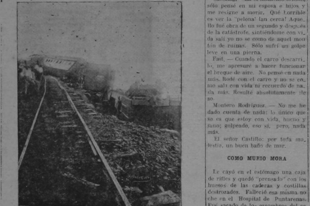
Posición en que quedaron los carros descarrilados en la "Roca de Carballo".